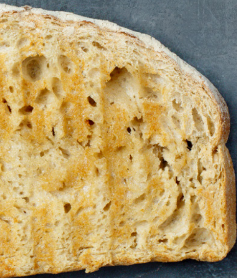
1 Scheibe geröstetes Landbrot mit Olivenöl